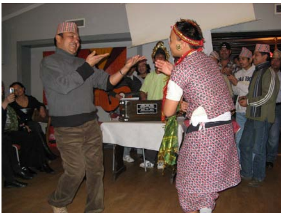
En beundransvärd insats gjordes av de dansande

De inledde lite blygsamt men ganska snart rycktes vi alla med i glädjen och klappade takten.