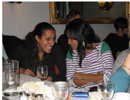
Två fnissiga tjejer på Tiharfesten